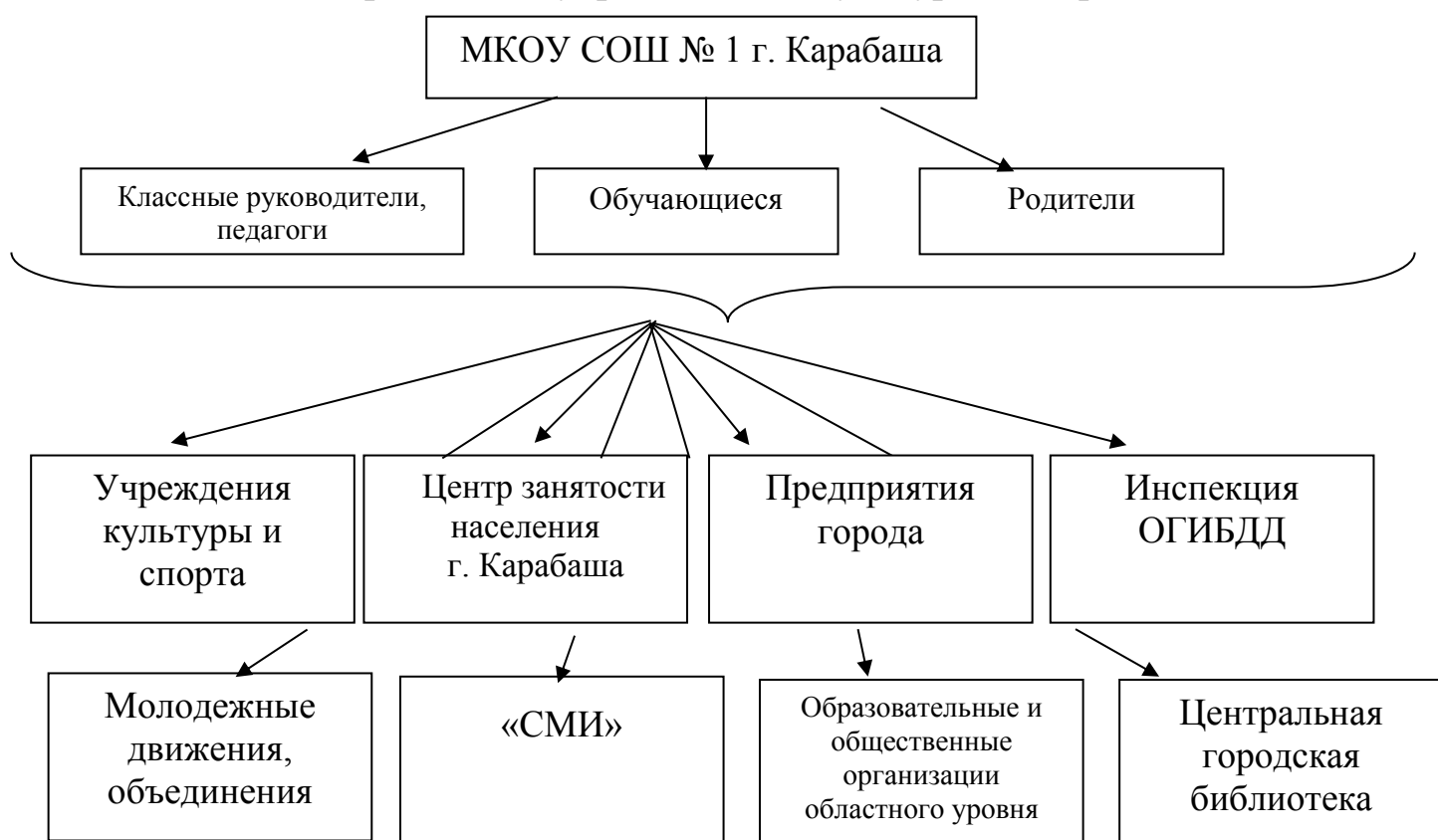
Схема совместной деятельности МКОУ СОШ № г. Карабаша с общественными организациями, системой дополнительного образования, учреждениями культуры и спорта

Социальное партнерство институтов общественного участия в процессе воспитания обучающихся начальной школы выражается в проведении совместных мероприятий.